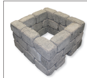
3. kerros ja valmis Firepit