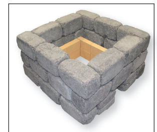
valmis Firepit tulitiilillä

Patinoitujen muurikivien määrä: patinoitu iso muurikivi 28 kpl matala muurikivi 4 kpl (lisätilaus tulitiilillä sisältää 18 kpl tulitiiliä)